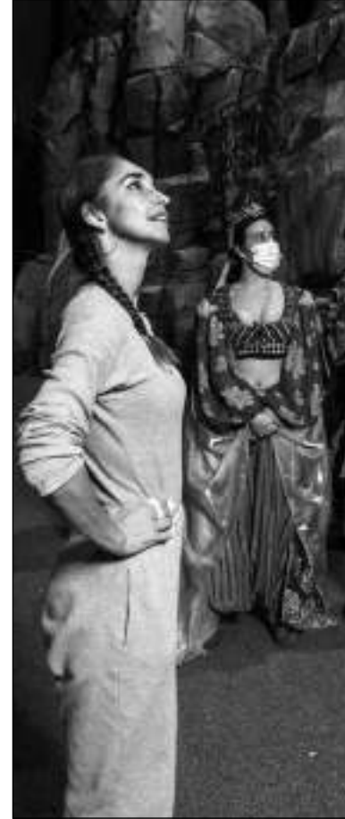
KARINE BRIANÇON Coreógrafa

En España, hay igualmente una importante tradición del traje de espectáculo, principalmente en Madrid (comedias musicales, filmación de películas, de series, etc.) Y los diseñadores de vestuario con los que trabajamos ya están acostumbrados. Nos instalamos en la región del prêt-à-porter, de las fábricas de zapatos y de ropa. A las costureras se les da muy bien.