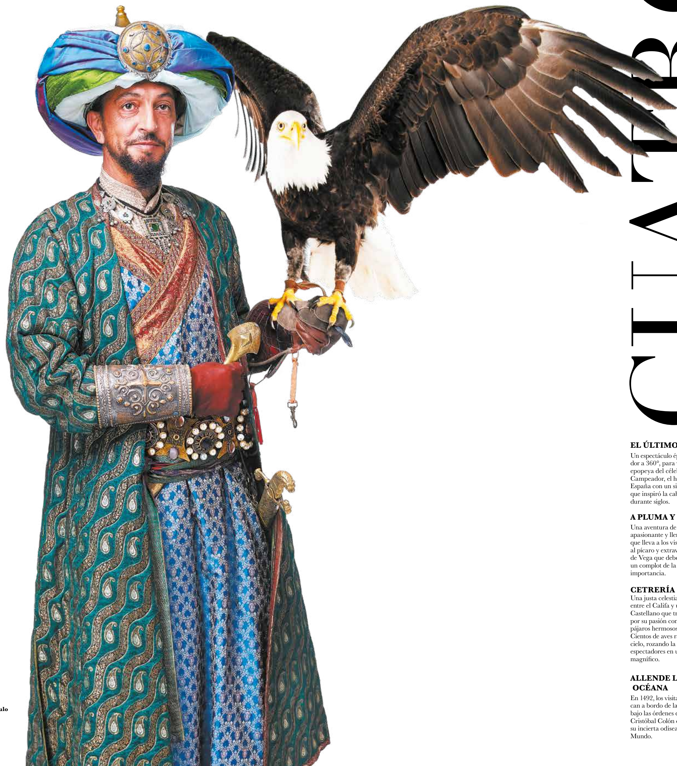
Abderramán III y su águila

Papel protagonista del espectáculo «Cetrería de Reyes» (Puy du Fou España)