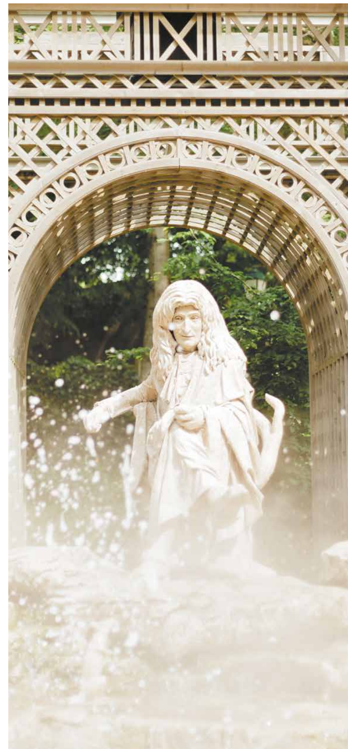
Estatua viviente de La Fontaine (Puy du Fou Francia)

«Le Monde Imaginaire de La Fontaine» ilustra la relación que Puy du Fou quiere mantener con la naturaleza y con los animales: una relación tierna, de proximidad, de bondad y de respeto. Como en las Fábulas, la naturaleza en Puy du Fou es el primero —y quizá el más hermoso— de los decorados, donde los animales ocupan un lugar indispensable. Como en La Fontaine, flores, árboles y animales están en el centro de nuestra creación.