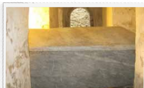
Sarcophage de Saint Philibert à Saint Philibert de Grandlieu.

Cependant, au-delà du recours au merveilleux chrétien caractéristique des hagiographies médiévales, les miracles de Saint Philibert dans le spectacle des Vikings retracent de façon symbolique l'action missionnaire des moines du Haut Moyen-Âge et l'évangélisation des Normands par le biais de l'adhésion de leurs chefs à la religion chrétienne.